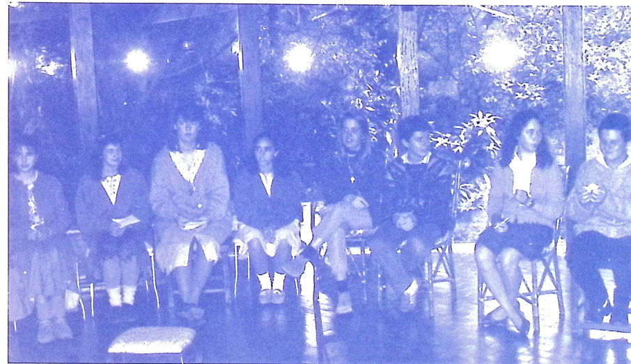
A Buenos Aires-i földrajz-érettségi jelöltjei 1988. július 31-én a szóbeli vizsga alkalmából.