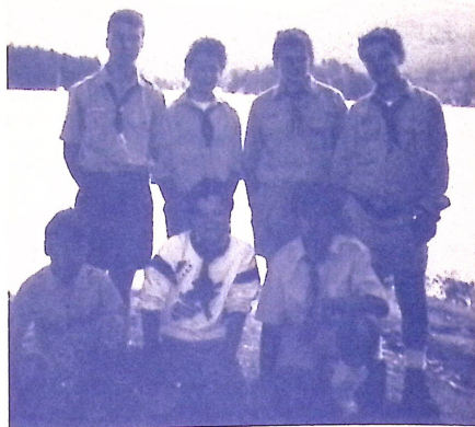
5. sz. Bornemisza Gergely csest. Szigeti nyári tábor, Lake George, NY, USA.