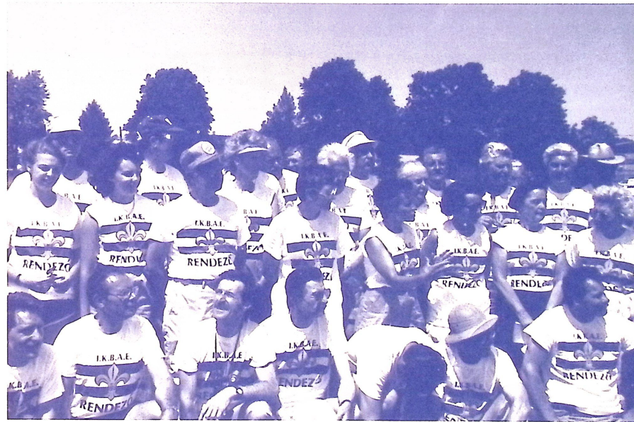
Sportverseny — 1988 június — NY körzet (USA). A rendezők napsütésben, jól végzett munka után.