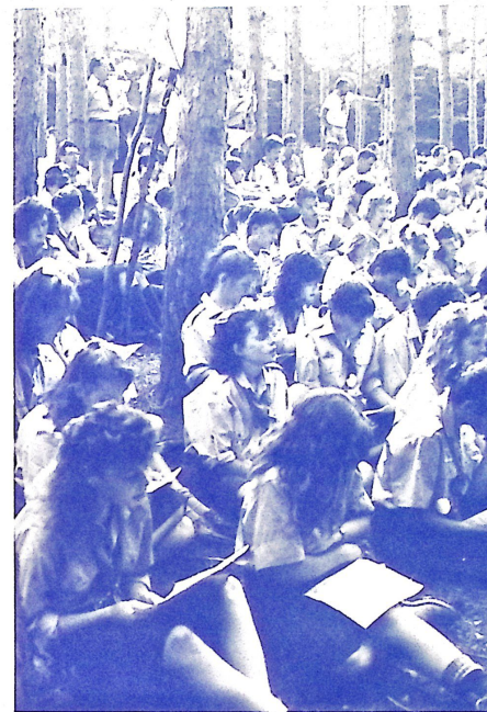
VK tábor '88: vasárnapi szentmise a Jenyőkatedrálisban. Sik Sándor Cserkészpark, Fillmore, NY, USA.