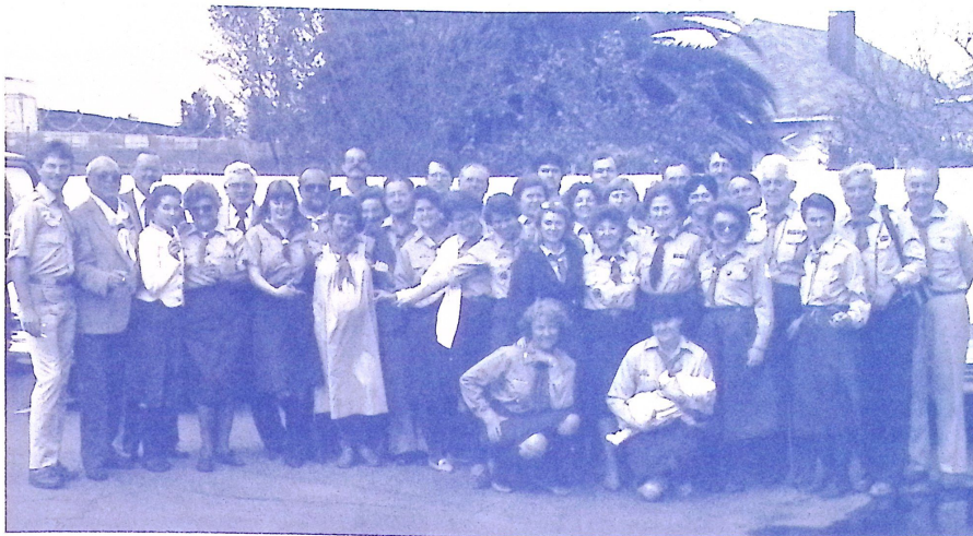
A kaliforniai cserkésztszti konferencia résztvevői, Los Angeles, CA, USA, 1988. február 27-28.

A műsor jól előadott és gondosan megrendezett számokból állt. A lányok egy székely népballadát mutattak be, a fiúk II. Rákóczi Ferenc szabadságharcából adtak elő néhány jelenetet. A kiscserkészek bábszínháza mindenkit jól szórakoztatott és megkacagtatott. A jubileum alkalmával találkoztak a „régiek” az „újakkal”, és együtt szórakoztak, beszélgettek, tapasztalatokat cseréltek, élményekről meséltek.