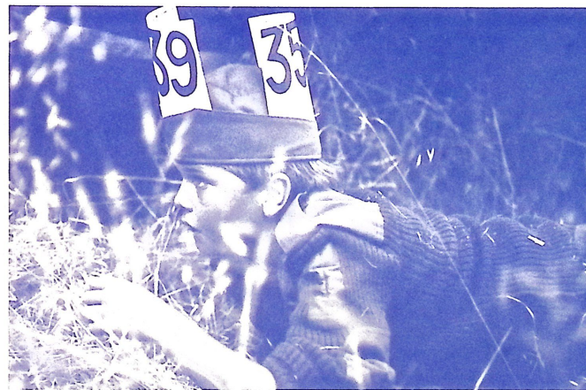
Kép — szöveg nélkül; számháború. Ezt komolyan kell venni.

A táborban elaludtam és amikor felébredtem, akkor ott láttam egy hintát. Kipróbáltam. A hinta nagy, fekete és nehéz volt. Amikor ráültem, akkor lejjeb ment. Ezt többször próbáltam és nagyon fáradt lettem. Reggel megreggeliztem és újra megpróbáltam. Jónak tűnt, de már megint lejjeb ment. „Nem szeretem ezt a hintát” mondtam. És megrugtam. Kemény volt és fájni kezdett a lábam.