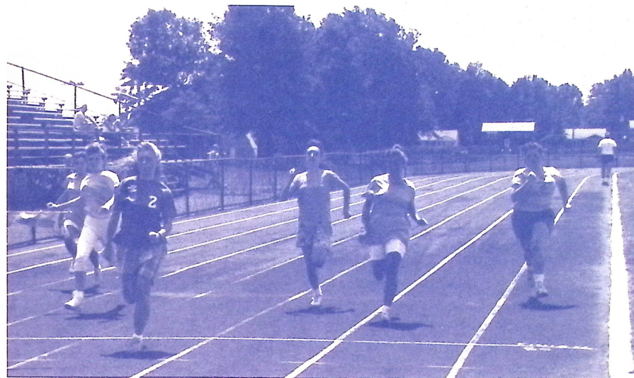
Sportverseny — 1988 június — NY körzet (USA). Hajrá lányok!