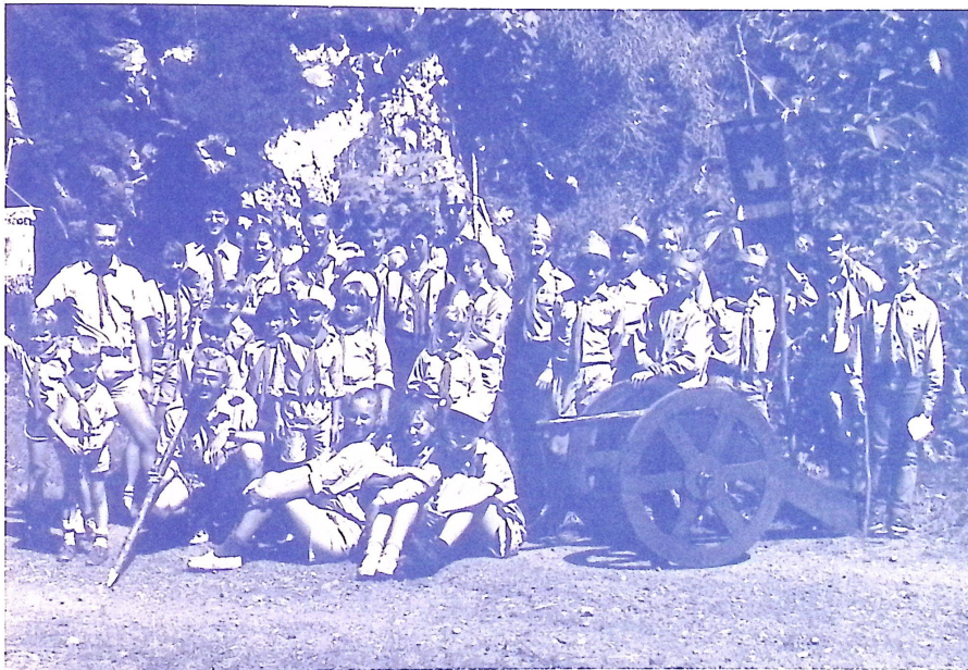
Vancouveri cserkészek — Budapest nagytábor.